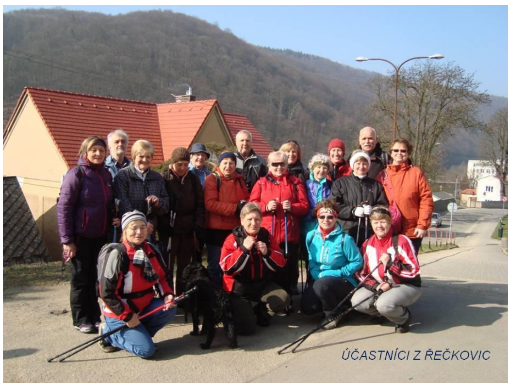
ÚČASTNÍCI Z ŘEČKOVIC