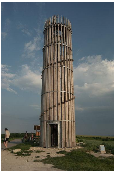
Rozhledna Akátová věž