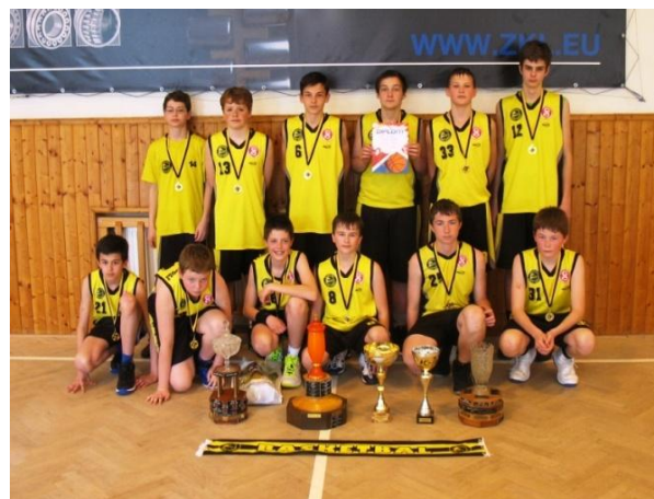
Vítězný tým žáků TJ Sokol Podolí