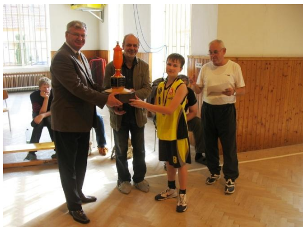
Pohár pro vítěze